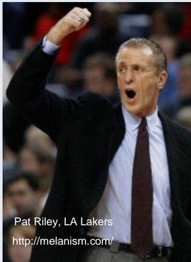
Pat Riley, LA Lakers