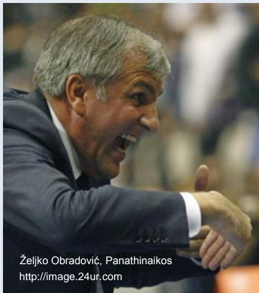
Željko Obradović, Panathinaikos http://image.24ur.com