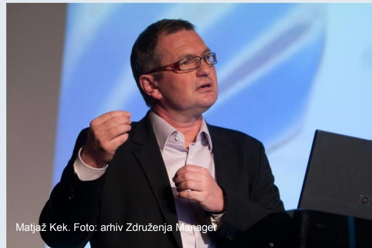
Matjaž Kek.