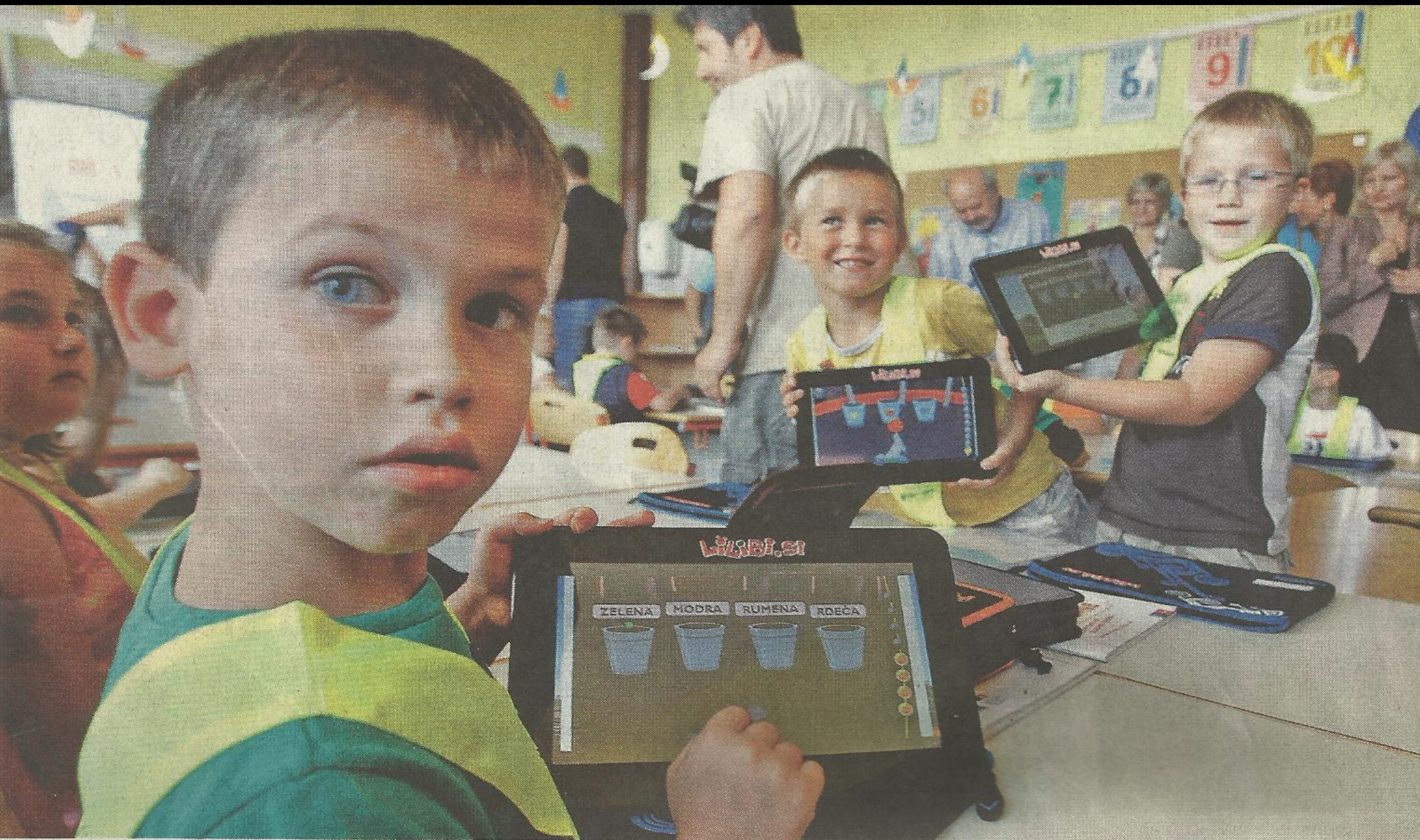
ŠOLA ZA PRIHODNOST – Otroci, ki so danes v prvem razredu, bodo iskali službe okrog leta 2030. Na fotografiji predstavitev e-pouka na ljublianski Osnovni šoli.