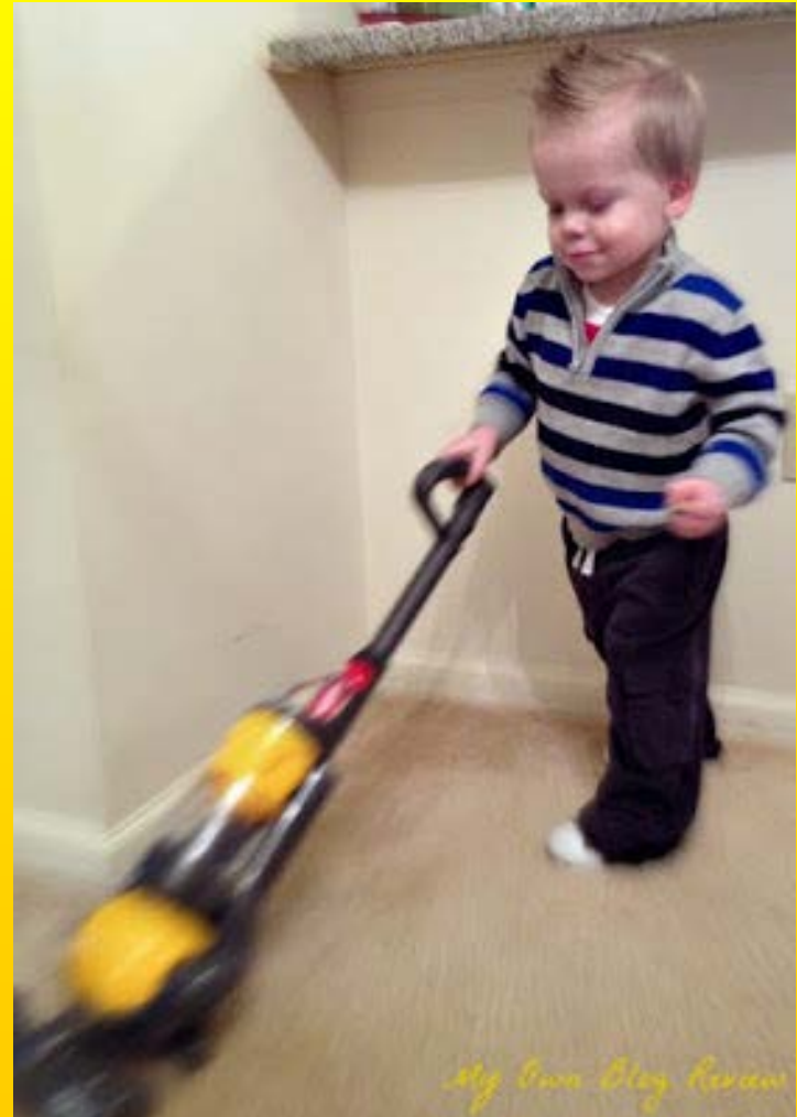
My Own Blog Review