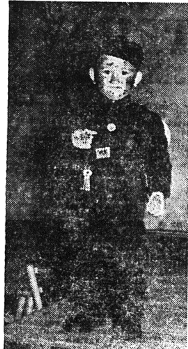
S kurentovanja najmlajših v Trbovljah. Če ste tegale vprašali, kaj je, so mu v smeh vzkipela rdeča usta in sajasti nosček: »Srečo nosim!«

d te li, ne ci it m zc pe k nj ni ti ča sk