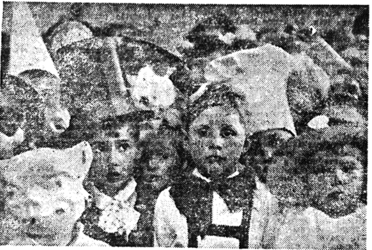
Tudi otroci so se veselili pustnih dni. Na sliki se sloer preveč resno držijo — najbrž so se ustrašili fotografa.